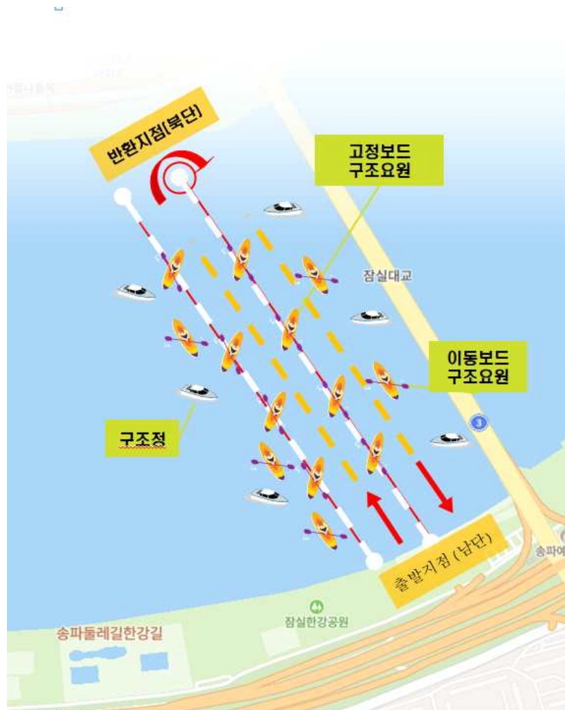
행사장 : 잠실대교 남단 수중보 도선장(잠실한강공원 제1주차장 앞)